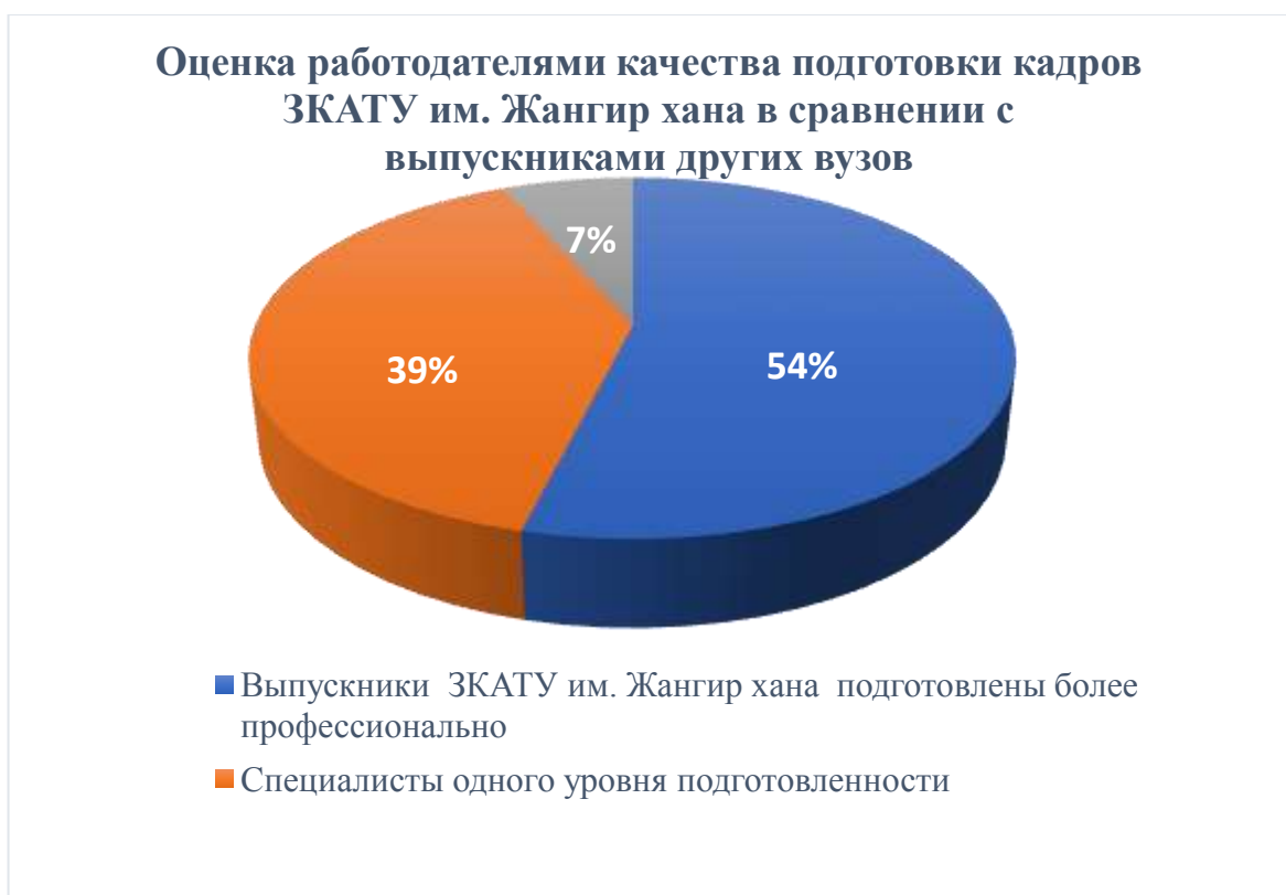
Рисунок 1- Оценка работодателями подготовки кадров ЗКАТУ им. Жангир хана

По уровню профессиональной подготовки работодатели выделяют выпускников университета среди выпускников других вузов. Более 54 % работодателей отметили более высокую профессиональную подготовленность выпускников университета (рис.1)