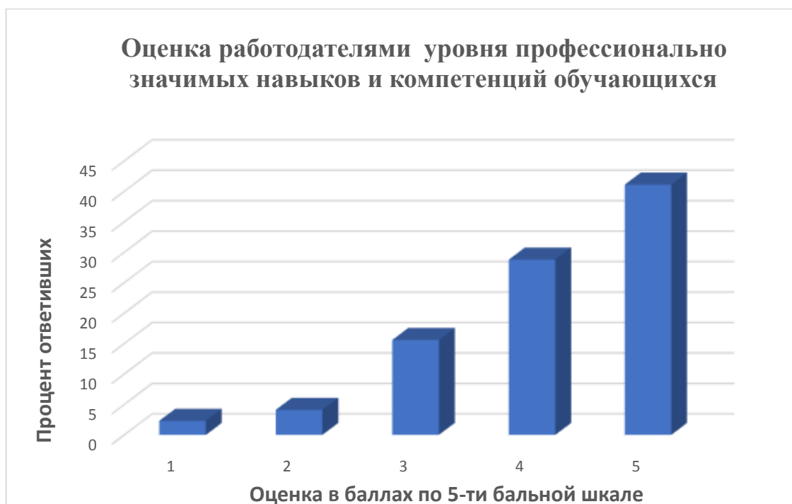
Рисунок 2 – Оценка уровня профессионально значимых навыков и компетенций

Главным направлением улучшения в подготовке выпускников по образовательным программам университета, работодатели считают улучшение уровня практической подготовки (рис.3).