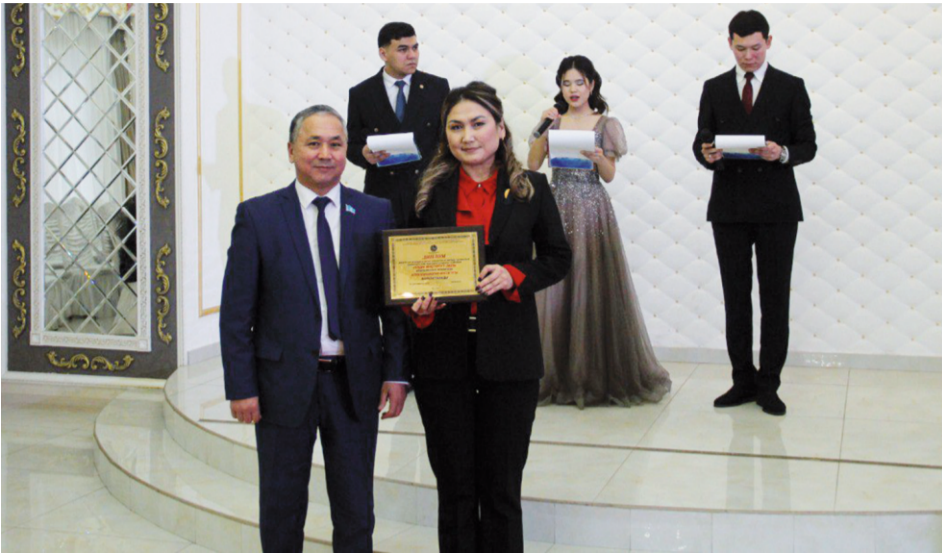
Агротехнология институты – «Үздік институт-2023»