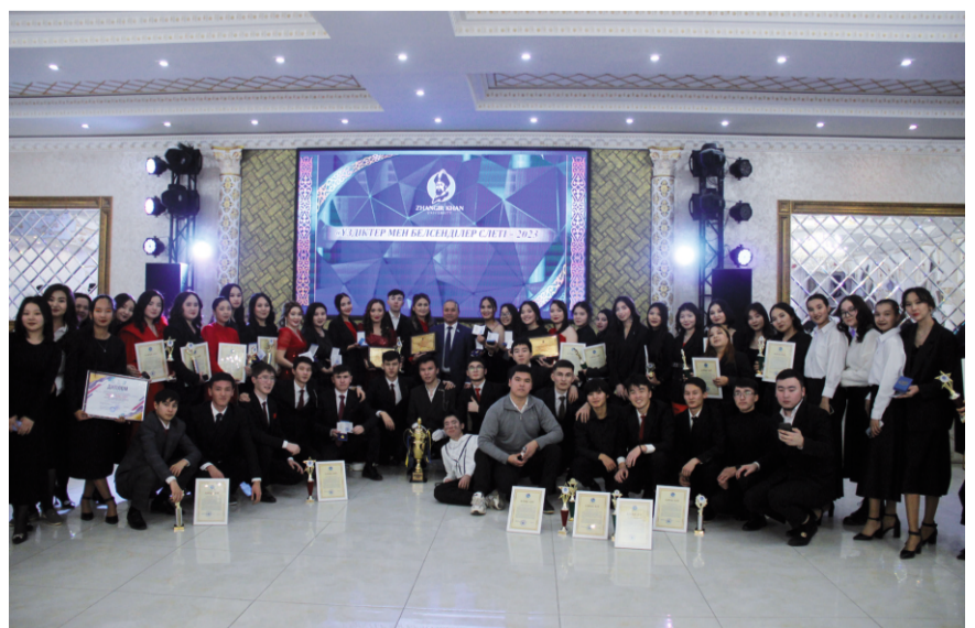
Газетіміздің 4-бетінде әр институт ұсынған үздік студенттердің жетістіктерімен таныса аласыздар.