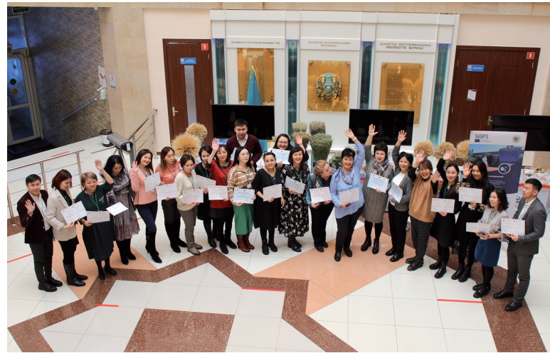
Участники блок-семинара по 3 модулю после вручения сертификатов

ружение в теорию и практику применения современных методов научных исследований с учетом опыта ученых и достижений докторантов из университетов Казахстана, России, Германии, Чехии, Польши. Программа блок-семинара была насыщенной: для аспирантов России и докторантов Казахстана были предусмотрены лекции ученых из Германии, Чехии и Польши, семинары, мастер-классы представлению научных материалов в международных изданиях. Синергия проектов и интеграция в научное сообщество, а также представление завершенных проектов с демонстрацией научных достижений на основе применения разнообразных методов научного исследования позволили качественно подготовить презентации