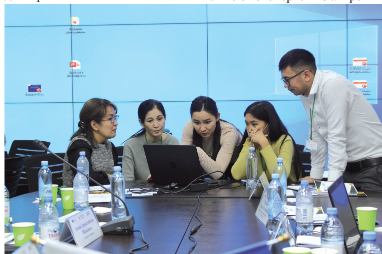
Участники проектной группы – докторанты КазНАУ и ЗКАТУ им. Жангир хана

Ландшафты и экономика России и Казахстана характеризуются большими сельскохозяйственными площадями. Политика обеих стран рассматривает инновационное развитие аграрного сектора как одно из приоритетных направлений своей деятельности. Наряду со всеми предпринимаемыми мерами ощущается нехватка квалифицированных специалистов и инновационного потенциала. Инициативы по наращиванию человеческого потенциала на всех уровнях (фермеры, специалисты, менеджеры), а также по совершенствованию деятельности вузов стали ответом на существующие недостатки. Несмотря на успешную реализацию Болонской реформы, вузы пока не могут стать конкурентоспособными на международном уровне, так как наблюдаются «утечка умов» молодых талантов, обучение по устарев-