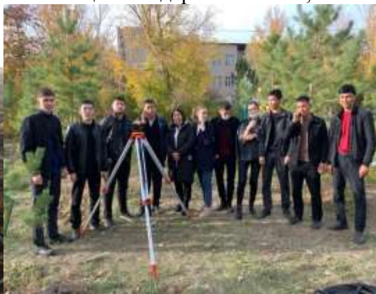
Дүйсеғалиев ШҚ-да және БҚАТУ полигонында