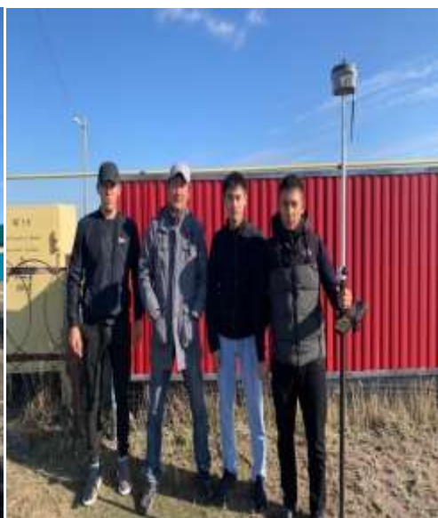
«Госградкадастр» мекемесінің мамандарымен ЗУ-13,31 топтары