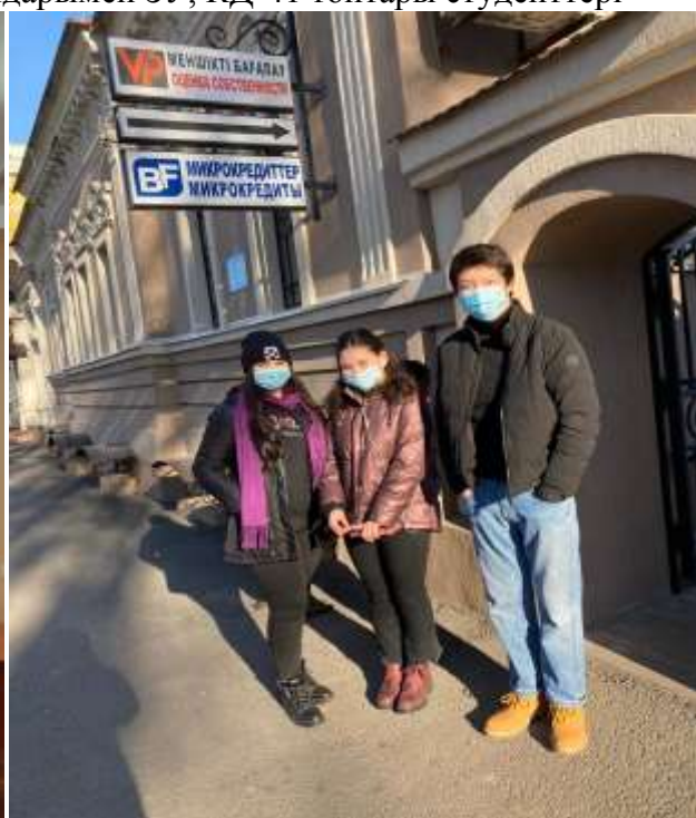
«Оценка собственности» мекемесінде сабақта КД-41,42 топтары

Топырақтану, агрохимия және жер пайдалану жоғары мектебі бойынша оқу - әдістемелік кешендердің инновациялық толықтырылуы төмендегідей болды: