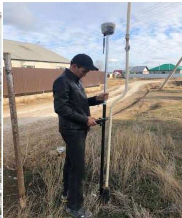
«Госградкадастр» мекемесінің мамандарымен ЗУ, КД-41 топтары студенттері